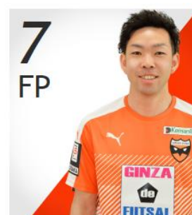
堀米 将太 HORIGOME Shota