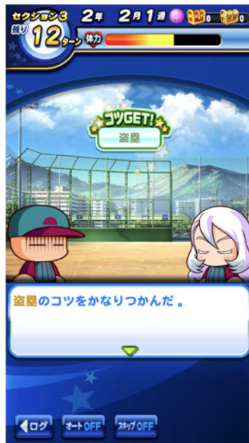
画面:①コツをかき集めろ!