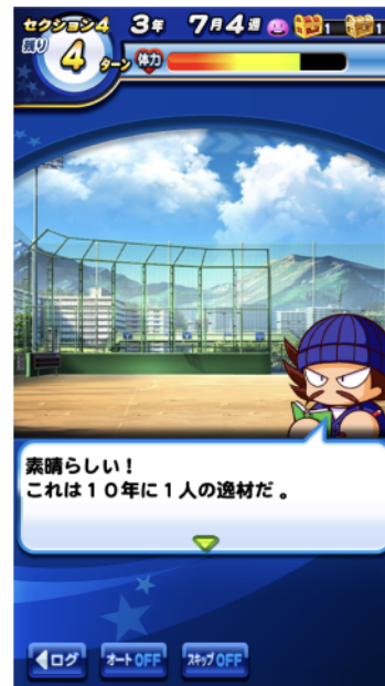
画面:②10年に一人の逸材