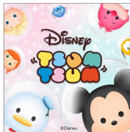
「AC版ディズニー ツムツムメドレー」 楽曲ジャケット

※ツムマスコットは全キャラクターが対象となります。 ※解禁されるのはマスコット1個につき1回、1プレイヤーにつき1回のみです。