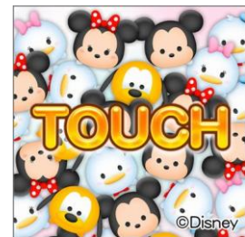
「AC版ディズニー ツムツム」 マーカー