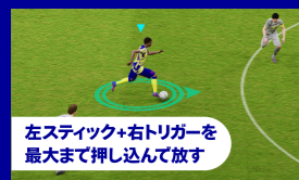
左スティック+右トリガーを最大まで押し込んで放す

左スティックを軽く倒すと、足元で小さいタッチでボールをコントロールします。深く倒すと、通常のドリブルになります。