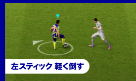
左スティック 軽く倒す