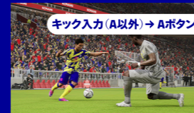
キック入力 (A以外) → Aボタン

パスやシュートの入力後、キックするまでにAボタンを押すとキックをキャンセルできます。ディフェンスがマッチアップ中なら、キックに釣られるのでかわせます。