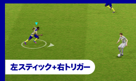
左スティック+右トリガー

ドリブル中やトラップ時に、右トリガーを瞬間的に最大まで押し込んですぐに放すと... 足元のサークルが二重円に変わり、強いタッチでボールを蹴り出します。