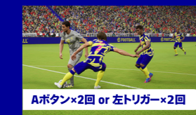
Aボタン×2回 or 左トリガー×2回

手でタックルを絶対出したい場面ではAボタン×2回 or 左トリガー×2回でタックル。Xボタンでショルダーチャージを行います。相手との距離が近く、並走している状況で使うとボールを奪うチャンスになります。