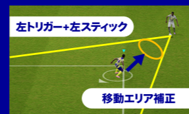
左トリガー+左スティック

積極的にボールを奪いに行きたい時はプレスを使用します (Aボタン)。敵に近づく自動でタックルをします。相手に積極的に近づく分かわされやすいので注意が必要です。