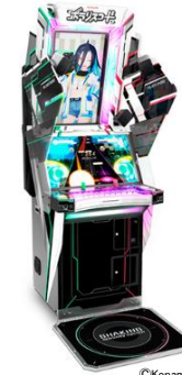
©Konami Amusement ポラリスコード