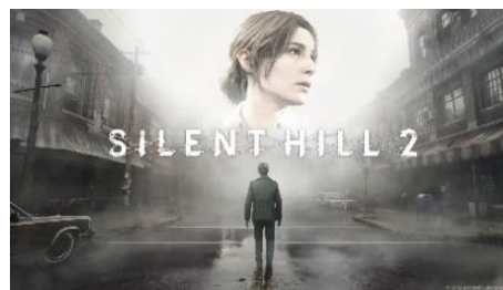
SILENT HILL 2