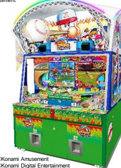
©Konami Amusement ©Konami Digital Entertainment パワフルプロ野球 開幕メダルシリーズ!