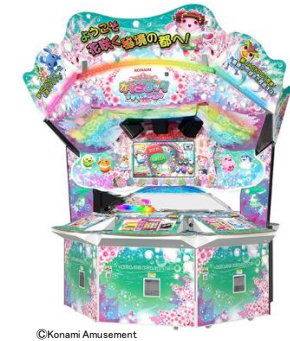
カラコロッタ まぼろしの桃源郷