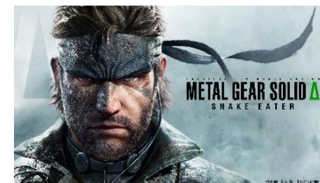
METAL GEAR SOLID Δ: SNAKE EATER

“PlayStation”は、株式会社ソニー・インタラクティブエンタテインメントの登録商標または商標です。 Nintendo Switch のロゴ・Nintendo Switch は任天堂の商標です。