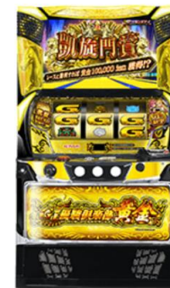
G I 優駿倶楽部黄金