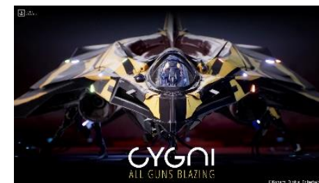
CYONI: All Guns Blazing