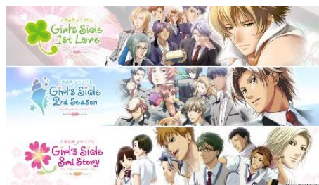
ときめきメモリアルGirl'sSide 1・2・3